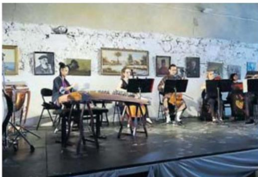
Un concert a été proposé au château de Saint-Guiraud dans le cadre des Musicales des Coteaux de Gimone.