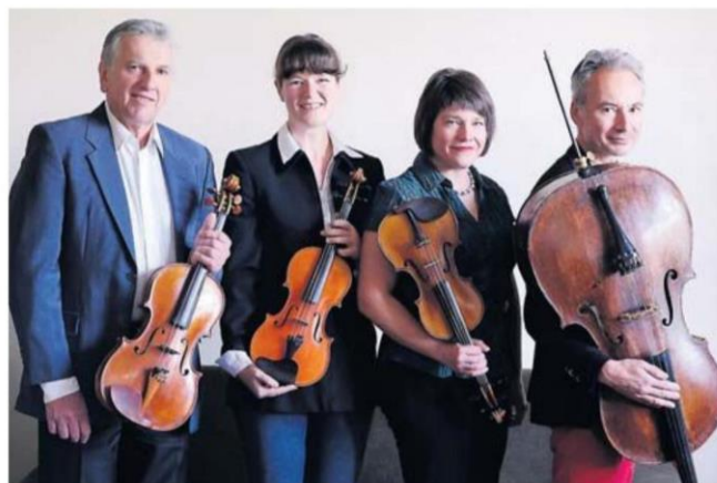
Le nouveau Quatuor Prazak se produira le 8 et 10 juillet.