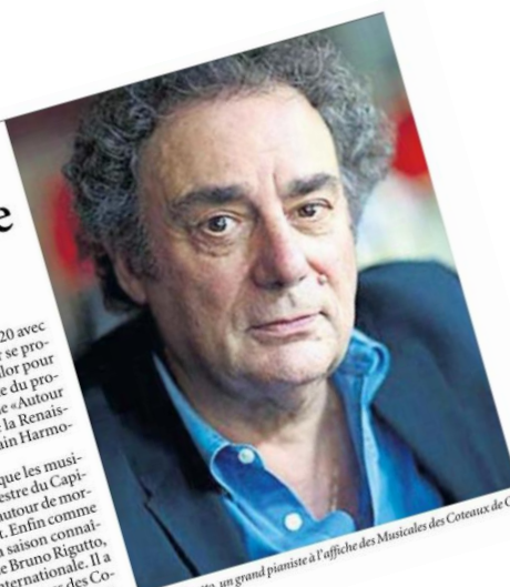
Bruno Rigutto, un grand pianiste à l'affiche des Musicales des Coteaux de Gimone.

Tous les détails sur www.musicalesdescoteaux.fr