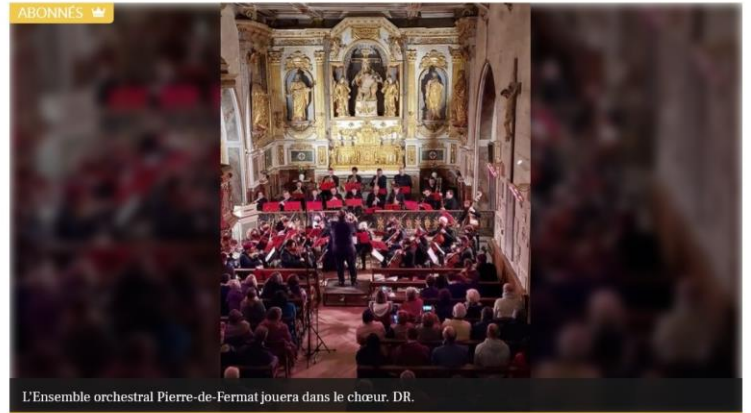
L'Ensemble orchestral Pierre-de-Fermat jouera dans le chœur.