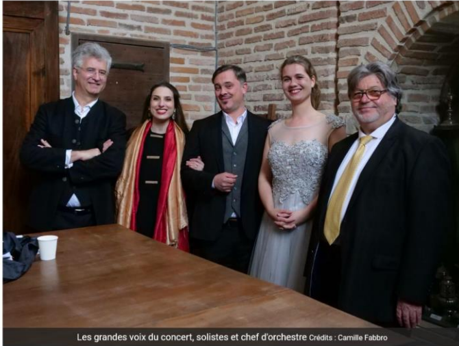
Les grandes voix du concert, solistes et chef d'orchestre