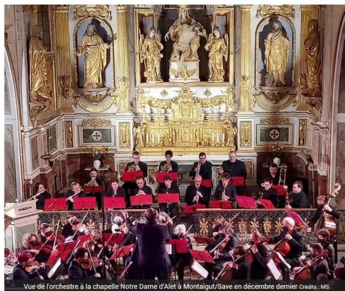
Vue de l'orchestre à la chapelle Notre Dame d'Alet à Montaignut/Save en décembre dernier Crédits : MS