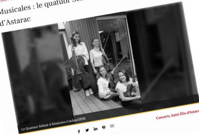
Le Quatuor Séléne à Sémézies-CachanDDM.