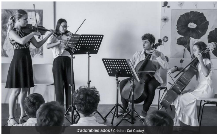
D'adorables ados !