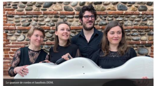
Le quatuor de cordes et hautbois, DDM.